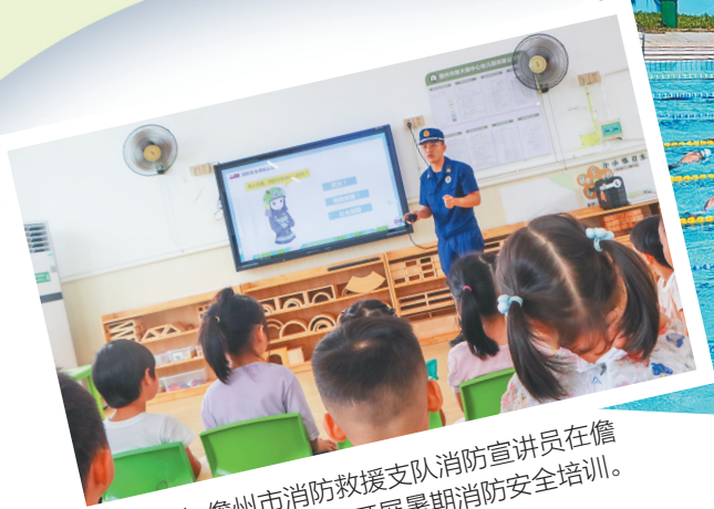
日前，儋州市消防救援支队消防宣讲员在儋州市那大镇中心幼儿园开展暑期消防安全培训。

野外水域水流湍急，容易发生溺水事件；儿童电话手表内暗藏诈骗陷阱……暑期，应该如何为孩子们织好安全网、系牢“安全带”？海南日报全媒体记者近期对此进行采访，为学生和家长送上暑期“安全锦囊”。