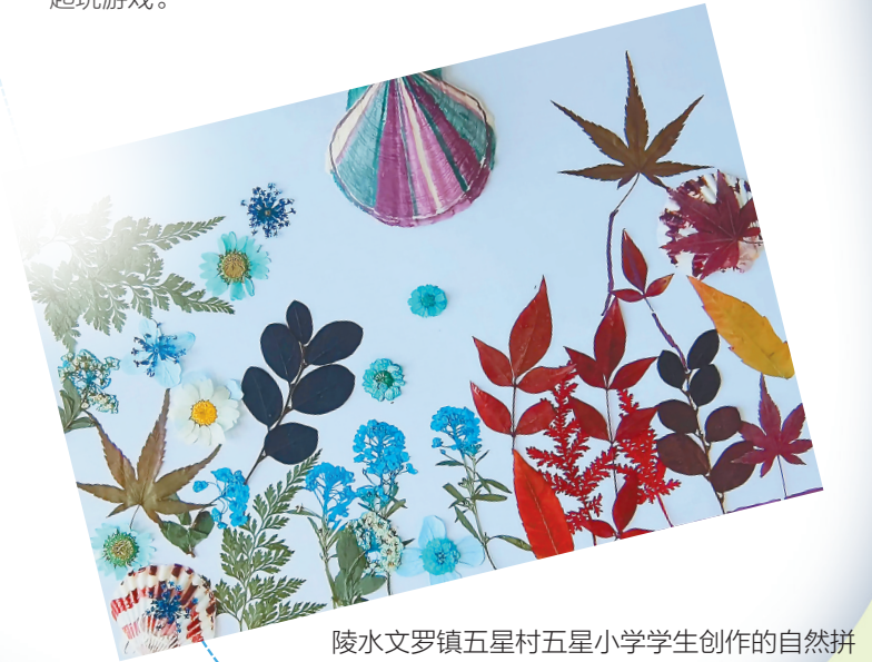
陵水文罗镇五星村五星小学学生创作的自然拼贴画。