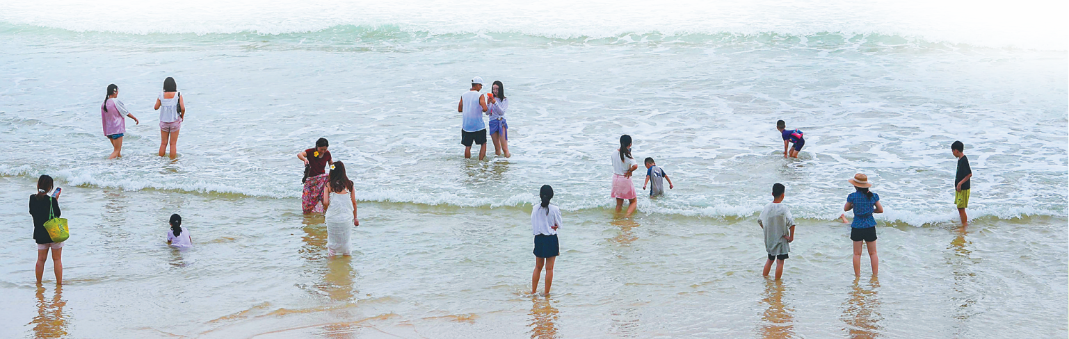
暑期戏水应选择安全水域，切不可前往未开发或未开放区域。图为人们在三亚大东海边游玩。

野外水域水流湍急，容易发生溺水事件；儿童电话手表内暗藏诈骗陷阱……暑期，应该如何为孩子们织好安全网、系牢“安全带”？海南日报全媒体记者近期对此进行采访，为学生和家长送上暑期“安全锦囊”。