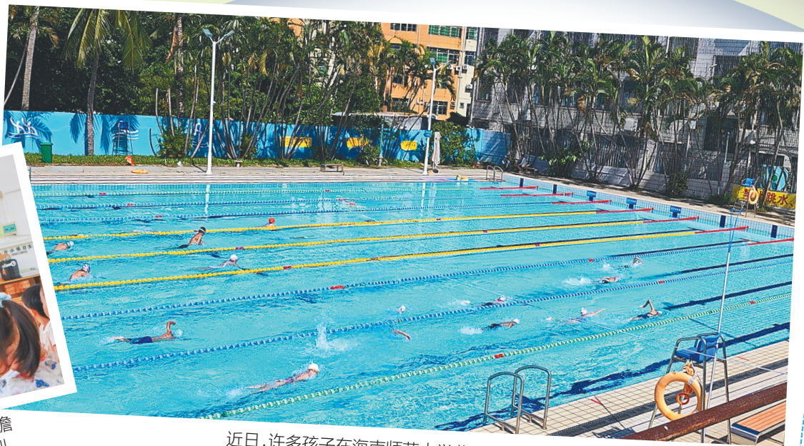
近日，许多孩子在海南师范大学龙昆南校区游泳馆学游泳。