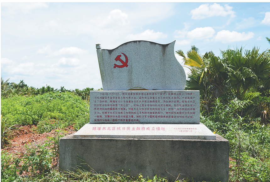
琼崖东北区抗日民主政府成立旧址。

当年11月10日,中共琼崖特委在下昌村召开琼崖东北区人民代表大会,宣布成立琼崖东北区抗日民主政府(以