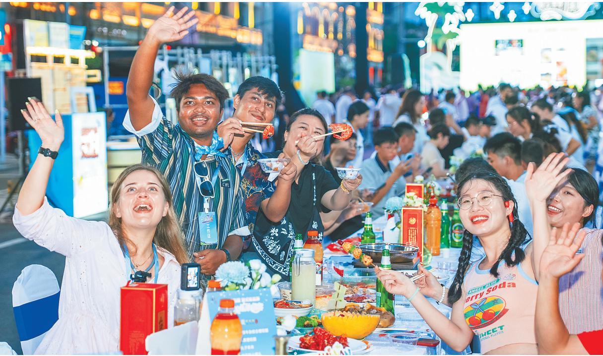
7月19日晚，在2025年“九九杯”海南（文昌）乡镇排球联赛铺前站的糟粕醋长桌宴上，中外游客品尝糟粕醋美食。