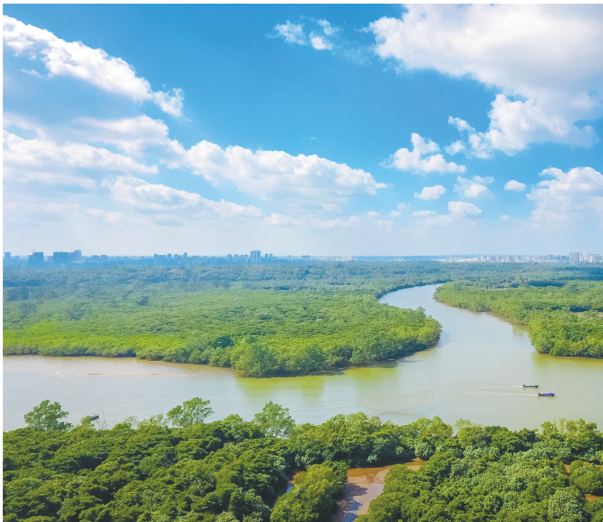
文昌八门湾一带的红树林。

海南岛四面环海，岛上群山连绵，兼具山海的地理环境，催生了许多因山岭、海湾形态产生的地名——比如六连岭、岭口镇、石壁镇、长坡镇、玉带滩、日月湾、八门湾。依据形态给一方水土命名，是自古以来传统，它沉淀着人们对海南的深情眷恋与细致观察。