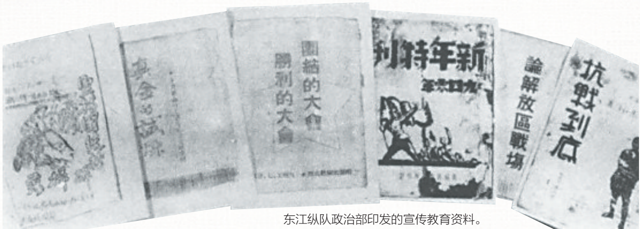
东江纵队政治部印发的宣传教育资料。