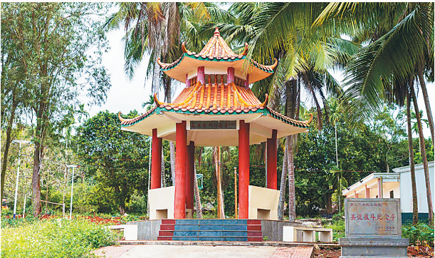
美德战斗纪念亭。

1946年5月，刘黑仔等10人在一次与国民党反动派军队的战斗中不幸牺牲，年仅27岁。☞