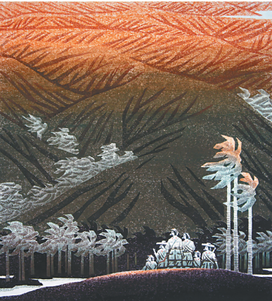
杨全发版画作品《娘子军·万泉河边的回忆》。