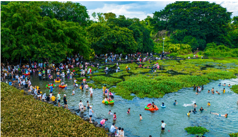
定安久温塘冷泉。