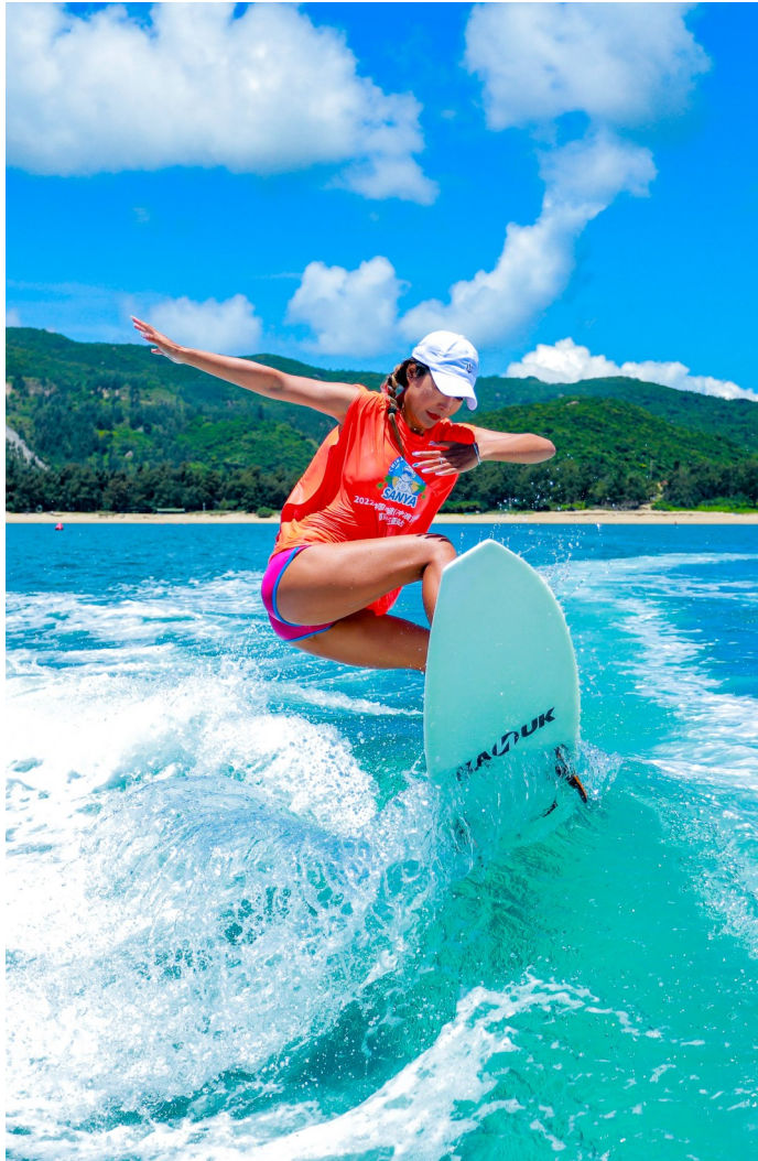
三亚后海尾波冲浪。