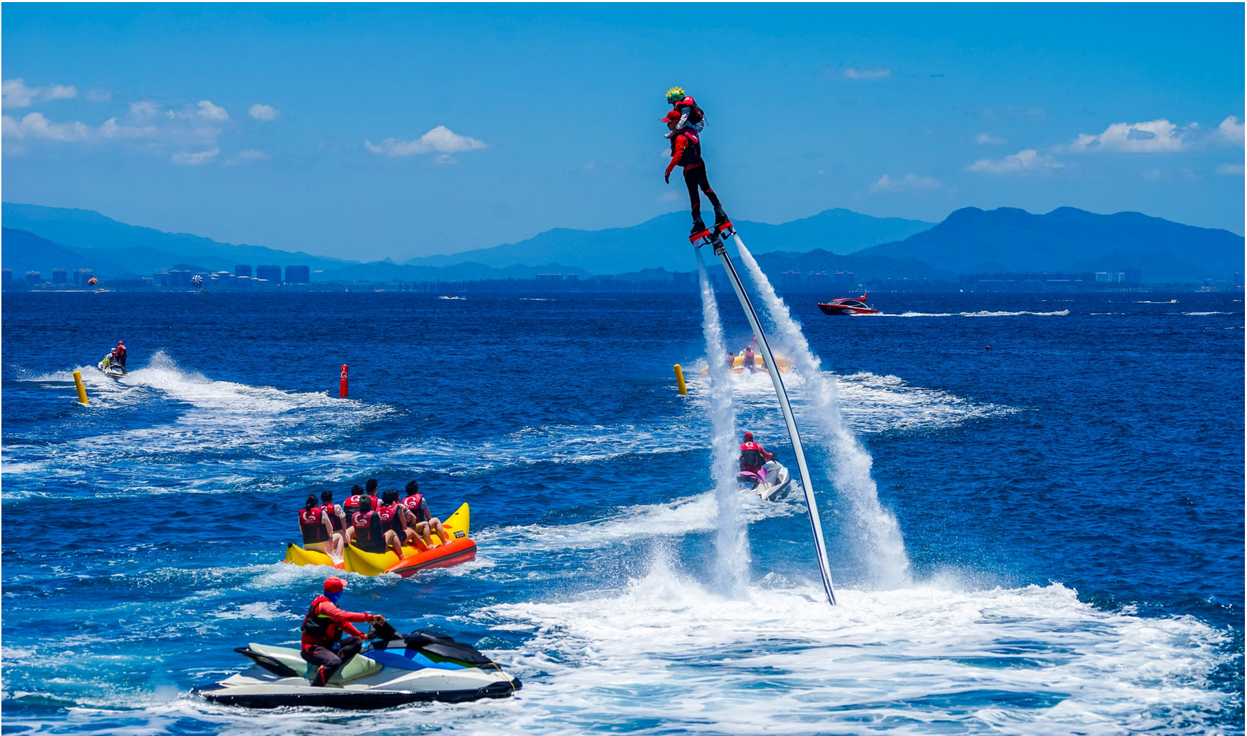
三亚蜈支洲岛水上项目。