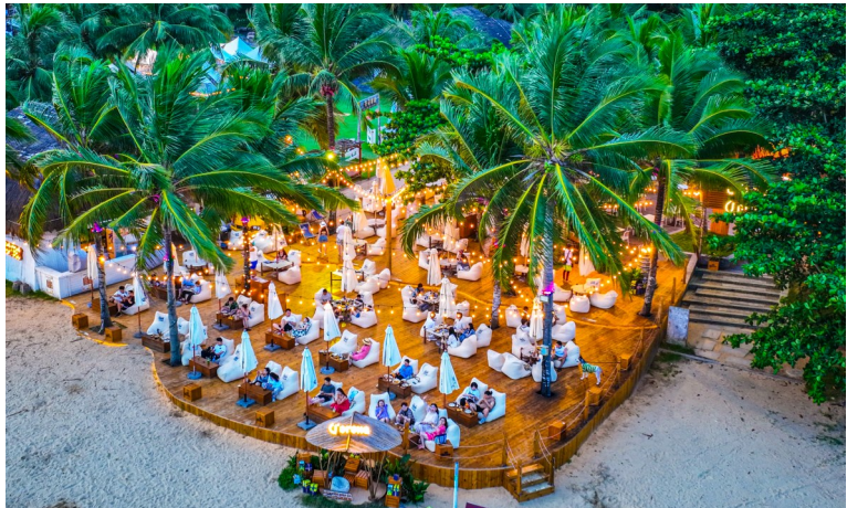
万宁神州半岛度假区。