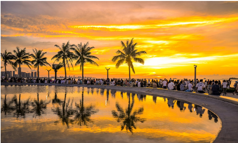
海口云洞图书馆日落。