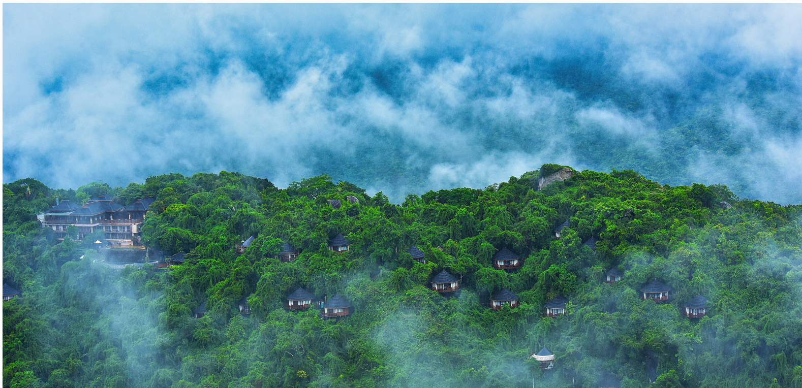
三亚亚龙湾热带天堂森林公园。