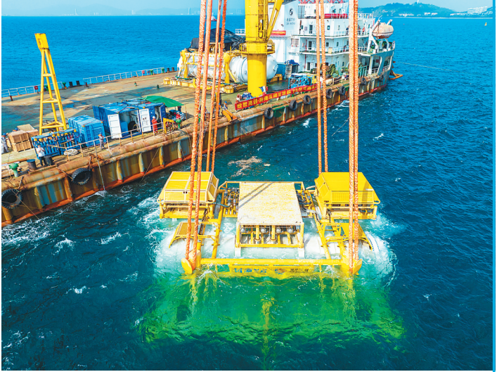
海南海底智算舱在陵水黎族自治县清水湾海域下水。（资料图）