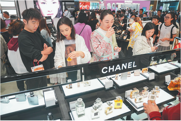
在cdf三亚国际免税城，前来选购免税商品市民游客络绎不绝。