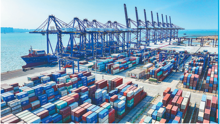
在洋浦国际集装箱码头，货轮停靠码头装卸集装箱。