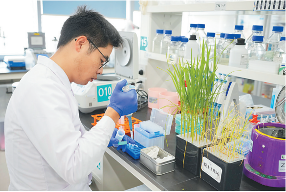
在三亚崖州区的中国农业科学院南繁研究院，年轻科研人员进行水稻实验。