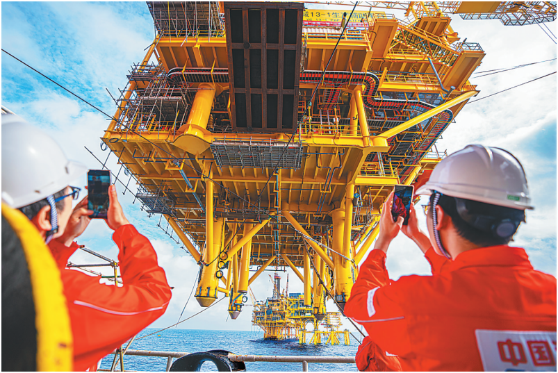
技术人员在记录“深海一号”二期工程综合处理平台水上生产组块吊装。（资料图）