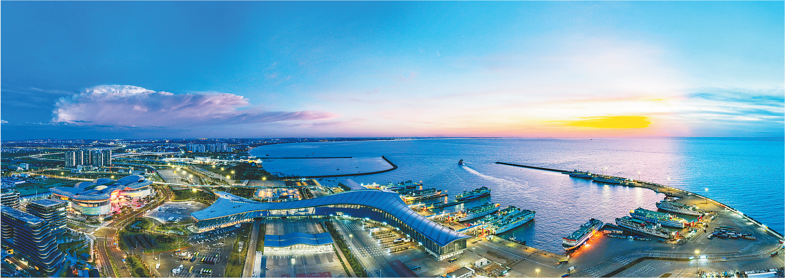
在海口市新海港，渡轮满载着游客，有序进出港口。