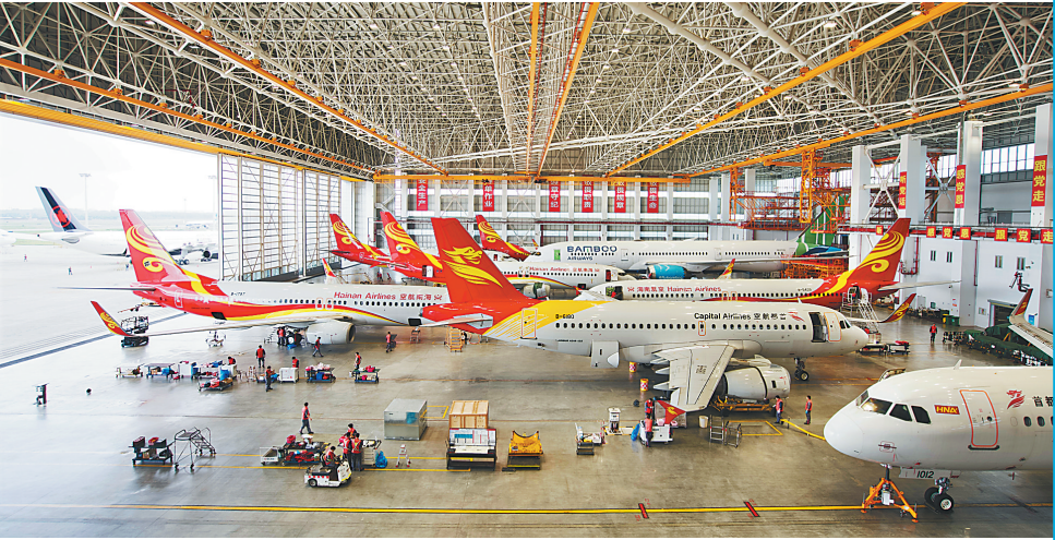
在海南自贸港一站式飞机维修产业基地定检机库，工作人员在各自岗位上作业。（资料图）