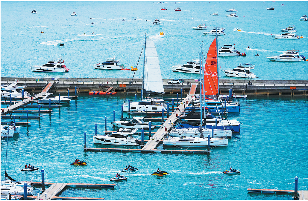
7月22日，三亚半山半岛帆船港附近海域，游客体验水上项目，尽享滨海夏日的清凉与欢乐。