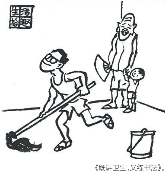
《既讲卫生，又练书法》。