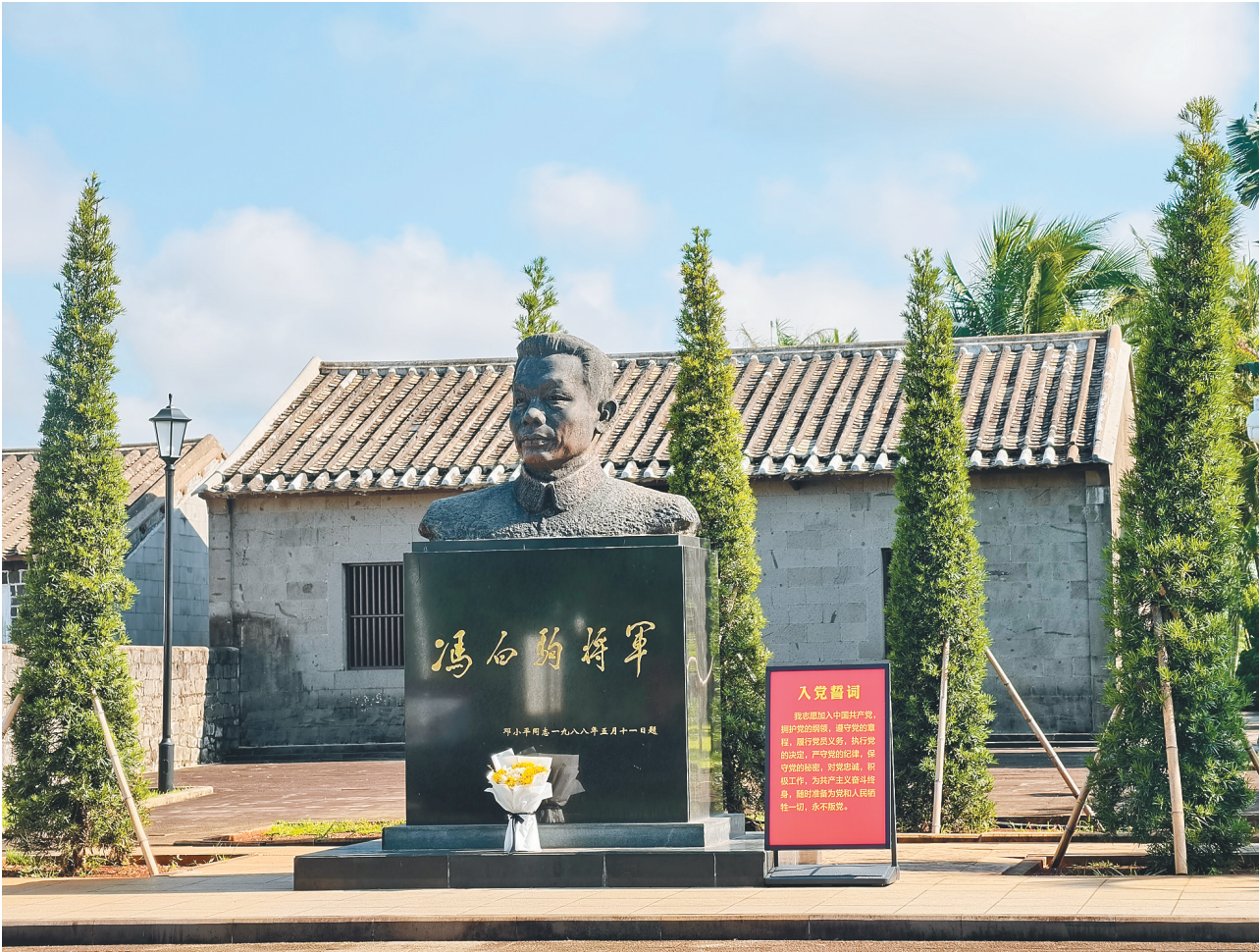
冯白驹雕像。

“当时冯白驹专门向海外侨胞致函，请求援助琼崖抗日。这在侨胞中引起了极大反响，大家纷纷解囊，捐款捐物，在所不惜。”