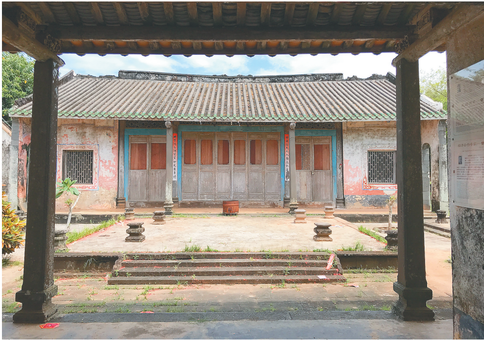
海口桂林洋迈德村曾氏宗祠。

晚清时局动荡，琼州虽孤悬海外，却并未与世隔绝。海南最后一位解元曾对颜因为北上广东、京师参加乡试、会试，目睹了时代的风云激变，写下诸多感时纪事、痛恨外侮的诗篇，体现了琼州士子的家国情怀。科举制度废止后，曾对颜执掌雁峰小学十年，为海南近代教育作出重要贡献。