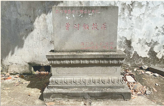
2012年，曾对颜故居被列为海口市重点文物保护单位。资料图