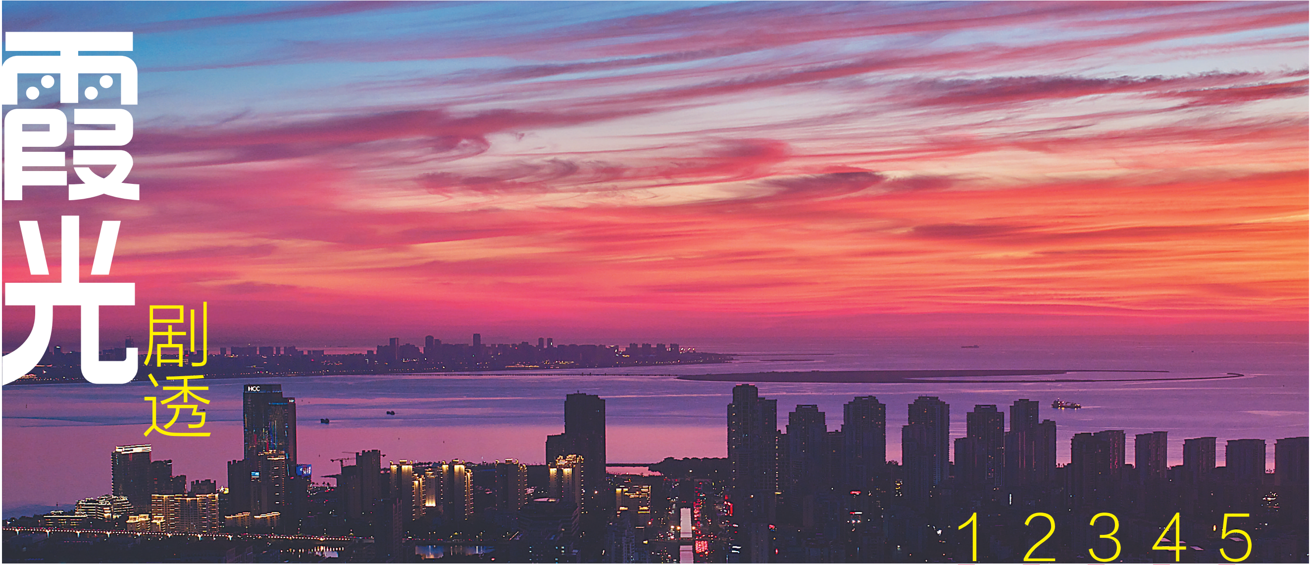
航拍夕阳下的海口。

日前,在2025年(第二十六届)海南国际旅游岛欢乐节开幕当天,海口市气象局、海口市旅文局联合发布“晚霞预报”产品,公众在“海口天气”微信公众号上可查看近3天的晚霞预报,海口成为我国为数不多拥有专业晚霞预报信息的城市之一。