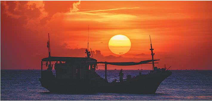
文昌木兰湾绚丽晚霞。