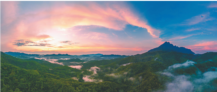
海南热带雨林国家公园五指山片区多彩霞光。