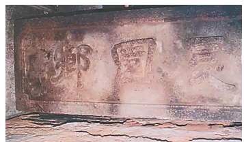
陈恭尹题字的“夏园乡”石匾。本版图片均为资料图

陈恭尹的隶书取法汉碑，主要脱胎于《夏承碑》与《曹全碑》，融合《夏承碑》的灵动与《曹全碑》的秀逸，笔法古拙浑厚，更有一种洒脱高迈的气概，形成“奇秀雄健”的独特书法风格。其作品兼具历史价值与艺术价值，颇受书法藏家喜爱。据专家考证，位于广州市北京路南段古牌坊上的题字“太平沙”，出自陈恭尹之手。广州市黄埔区夏园村村口的“夏园乡”石匾题字，也是他创作的。