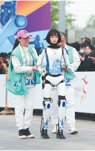
在二〇二五世界机器人大会中在跑步。