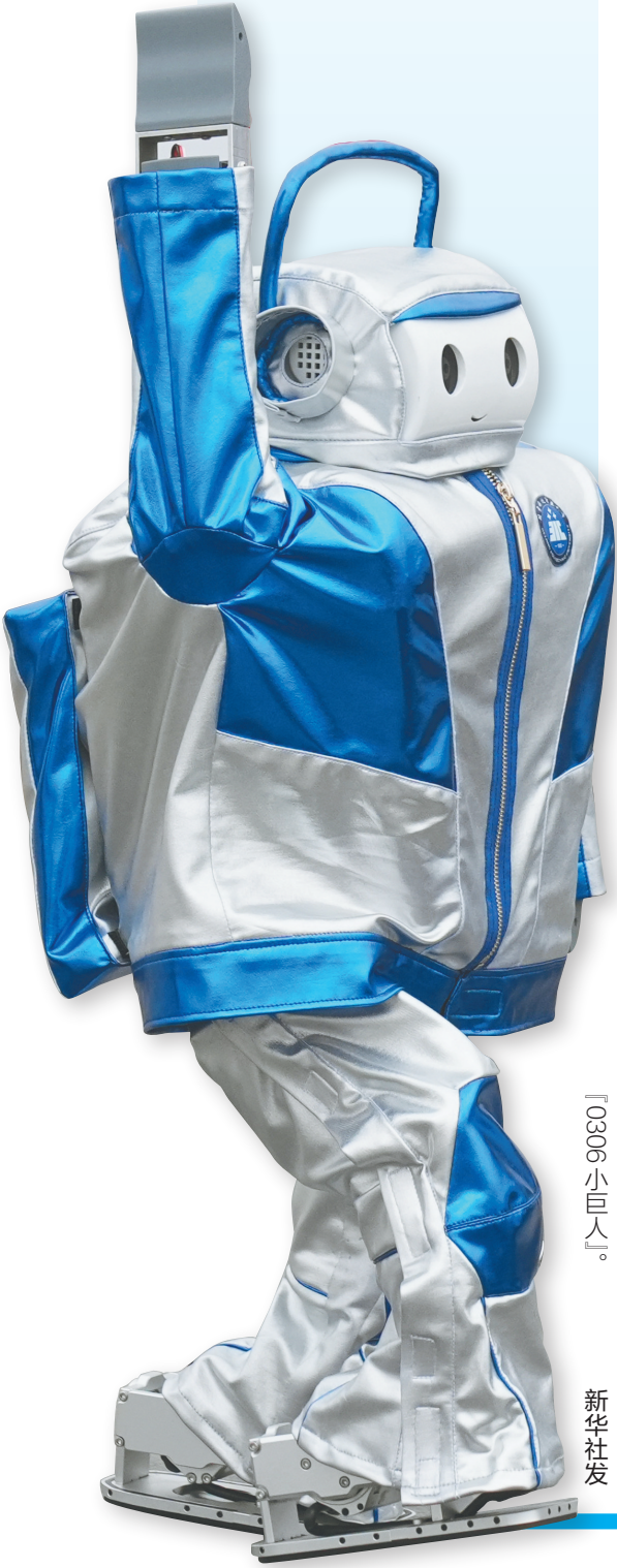
北京科技职业学院研制的机器人「G0306小巨人」。

从登上春晚表演到人机共跑“半马”，从绿茵场上踢球到拳击台上打擂……人形机器人技术和产业的快速发展引人关注。 人形机器人能进厂打螺丝、进家做家务了吗？真正“让机器人干活”，还需要多久？带着这些问题，“新华视点”记者走进正在北京举办的2025世界机器人大会寻找答案。