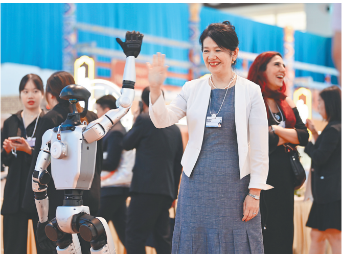
嘉宾在第十六届夏季达沃斯论坛文化之夜上和 人形机器人互动。 新华社发