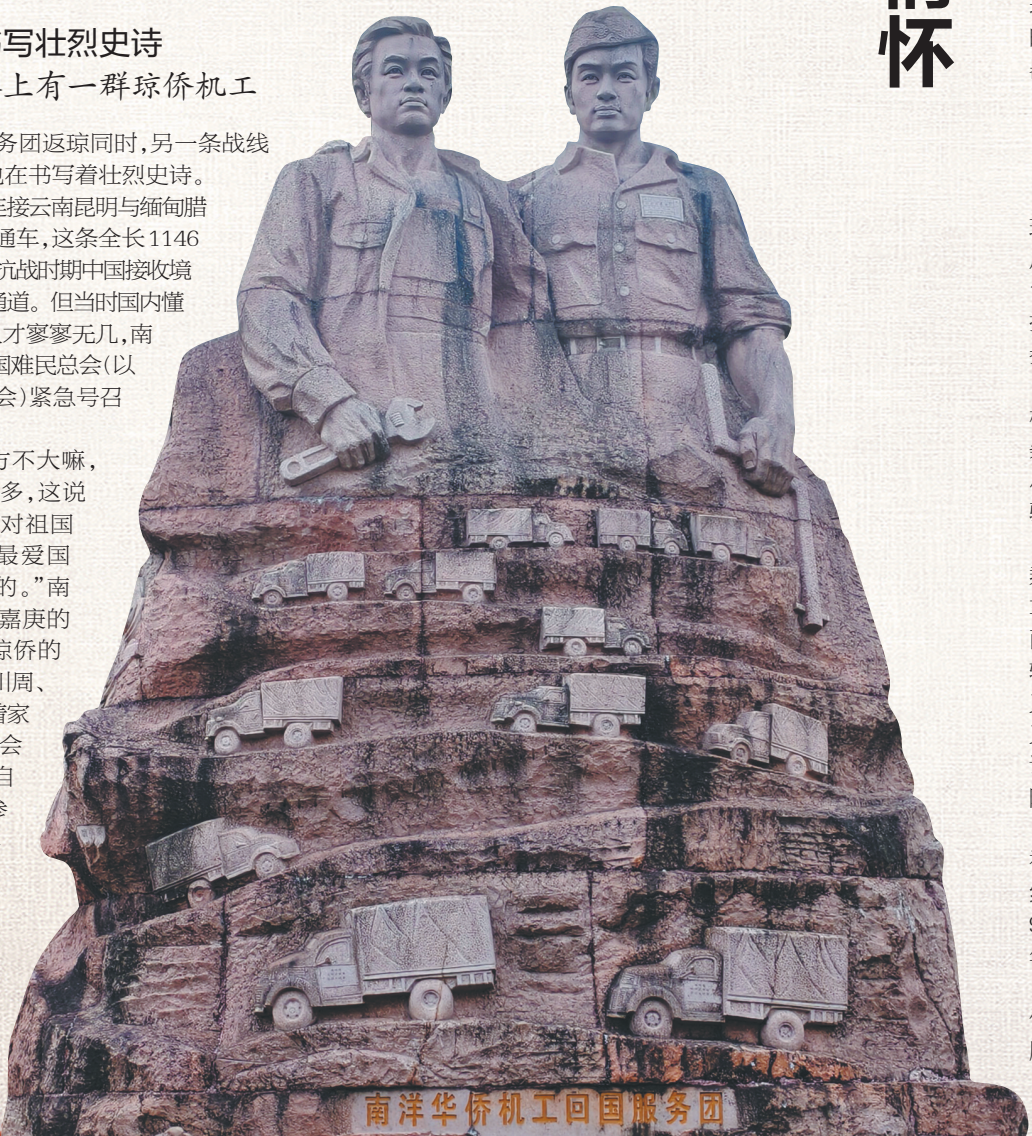
南洋华侨机工回国服务团