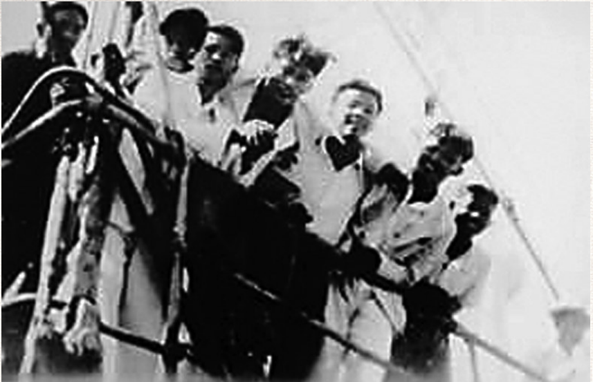
1938年2月，一批泰国华侨青年自曼谷乘船回国参加抗战。(资料图)