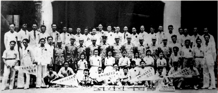
1939年8月13日，新加坡孟里同乡会纪念“八一三”售花助赈暨欢送回国机工大会合影。