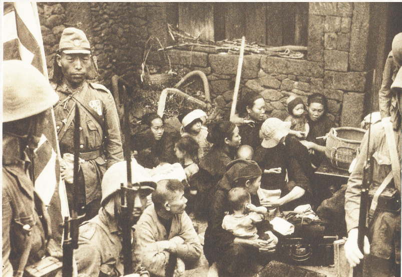
日军多次“扫荡”儋县七里村(今属儋州市中和镇),杀害大量无辜村民。图为日军将该村村民围在一个角落。