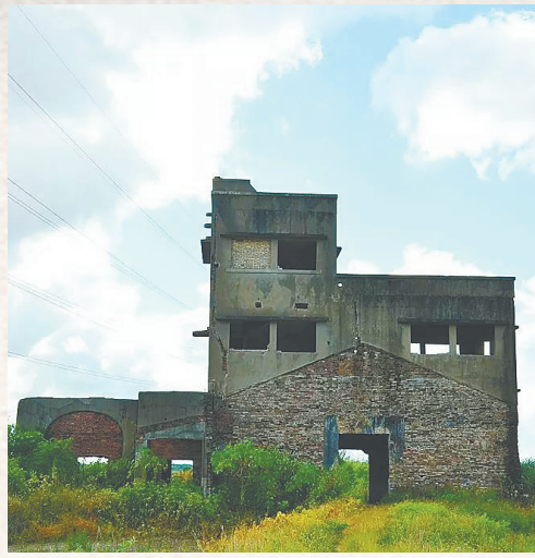
日军设在黄流的机场指挥塔楼。 资料图

乐东黎族自治县黄流镇东北约一公里处,田野平坦,绿意盎然。只是田野中间,一栋破旧的小楼孤独伫立,与周围的风光格格不入。似乎是草地上竖起的钢钉、大海中突然出现的礁石,给人刺痛、冲击感。