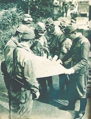
日军在海南岛“蚕食”途中。

铭记苦难历史,汲取前行力量。80多年前,那些关于抗争的、不屈的、奋起的故事,需要我们一直讲下去。