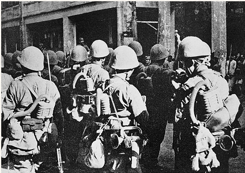
登陆海南岛的日军化学部队。