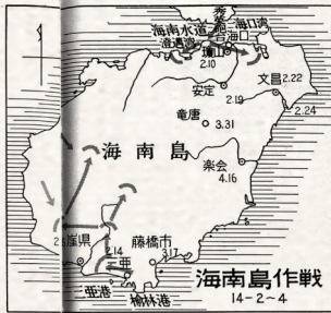
日军侵犯海南岛前一周制订的作战地图。图中有一处错讹,把“定安”写作“安定”。