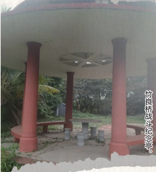
竹畠桥战斗纪念亭。