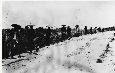
抗战时期转战在敌后的部分琼崖抗日独立总队战士。 本版图片均为资料图

从1939年到1945年，琼崖军民孤岛奋战，克服武器装备落后等方面劣势，采用灵活机动的战术打击敌人，拖住了大量日军兵力。中共琼崖特委坚持独立自主原则，坚持团结抗战，坚持依靠和发动群众，最终迎来抗日战争的胜利。6年多的时间里，军民携手抗击日寇，涌现一批经典战例。