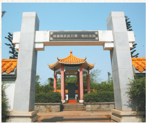
潭口琼崖纵队抗日第一枪纪念园。