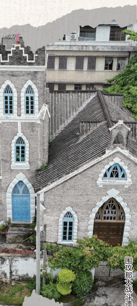
围攻那大战斗遗址。