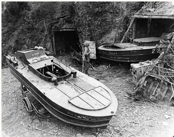
日军使用的自杀性震洋艇。