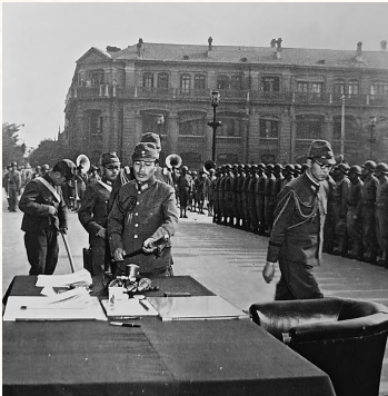
日军在天津受降仪式上交出军刀。

据《海南警备府战时日志》中的统计资料:日本宣布投降时,在海南岛的中国台湾籍人员共有21122人,其中由日本海军移交中国方面的属于日军海南警备府相关人员(即所谓由台湾籍士兵组成的警察队人员)15067人。日本投降后,这些滞留在海南岛的台湾籍人员开始陆续被遣返台湾,也有一部分人最终留在了海南岛,海南石碌铁矿等地,留下了他们的生活痕迹。对台湾籍人员的遣返,可以说是旷日持久,直到1949年才结束。■