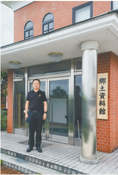
金山到日本的图书馆查阅资料。