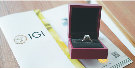
这是记者以150多元从网店购买的假钻石及其附带的假证书。