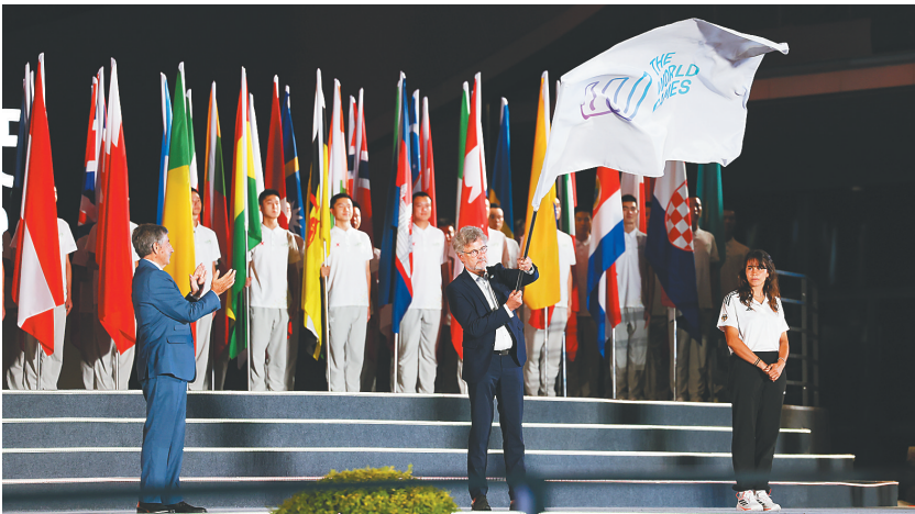
8月17日，第12届世界运动会闭幕式在成都举行。图为在闭幕式上拍摄的国际世界运动会协会会旗交接仪式。

成都世运会组委会主席施小琳、国际世界运动会协会主席何塞·佩鲁雷纳先后致辞，向为本届世运会圆满成功作出贡献的所有人员表示感谢。下届世运会举办城市德国卡尔斯鲁厄市市长弗兰克·门特普鲁致辞，热情邀请全球宾客四年后相聚卡尔斯鲁厄。20时50分，佩鲁雷纳宣布成都2025年第12届世界运动会闭幕。大屏幕显示，矗立于开幕式主会场的世运会主火炬塔火焰，伴随着《友谊地久天长》的童声合唱缓缓熄灭。在背景音乐《成都》的动人旋律中，多名舞者以舒展的肢体语言，舞出和谐交融之韵。最后，舞者们共同挥手致意，既作别今宵，更相约未来。