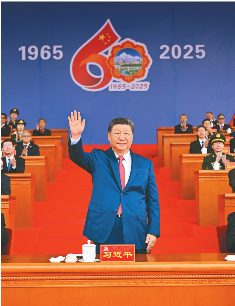
8月21日上午，西藏各族各界干部群众约2万人欢聚拉萨市布达拉宫广场，热烈庆祝西藏自治区成立60周年。中共中央总书记、国家主席、中央军委主席习近平出席庆祝大会。