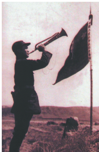
埃德加·斯诺1936年8月在豫旺堡(今宁夏同心县预旺镇)拍摄的经典照片《抗战之声》。

1933年9月，斯诺的第一本著作——通讯集《远东前线》(《Far Eastern Front》)在美国出版。他在书中写道：“昨天他们的军事理论是：为了保卫日本关东‘租借地’，必须占领满洲。更早一些，他们的军事理论是：为了保卫本国，必须占领朝鲜；而明天他们的军事理论将是：为了保卫热河，