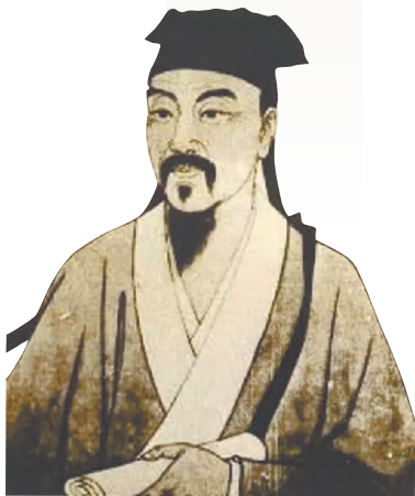
郦道元画像。资料图

中国古代以农业立国，对水源与河流一向十分重视。早在春秋战国时期，《尚书》《周礼》《山经》等著作中就出现了有关水道分布的记载。作为中国第一部记述水系的专著，《水经》记述了全国137条主要河流的水道情况，但记载相对简略也缺乏系统性。最终，北魏郦道元所著的《水经注》成为之后的集大成者。