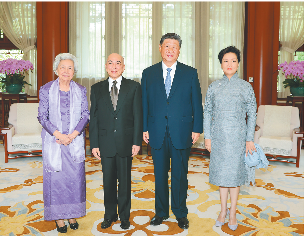
八月二十六日上午，国家主席习近平和夫人彭丽媛在北京南海亲切会见柬埔寨国王西哈莫尼和太后莫尼列。

新华社北京8月26日电 8月26日上午，国家主席习近平和夫人彭丽媛在南海亲切会见柬埔寨国王西哈莫尼和太后莫尼列。 习近平热烈欢迎西哈莫尼国王和莫尼列太后再次来华，也欢迎西哈莫尼国王出席中国人民抗日战争暨世界反法西斯战争胜利80周年纪念活动。习近平表示，今年4月我对柬埔寨进行国事访问，受到国王陛下和柬埔寨人民热情友好接待，至今想起都