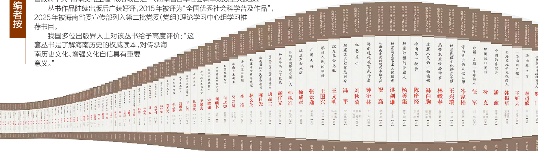
《海南历史文化名人丛书》书影。

百位先贤的名字汇聚书脊之上,百册图书错落叠成“100”的造型——《海南历史文化名人丛书》全系列100种发布会上的这一幕,令人瞩目。这是海南文化建设的里程碑时刻,也是对海南杰出先贤的深情礼赞。