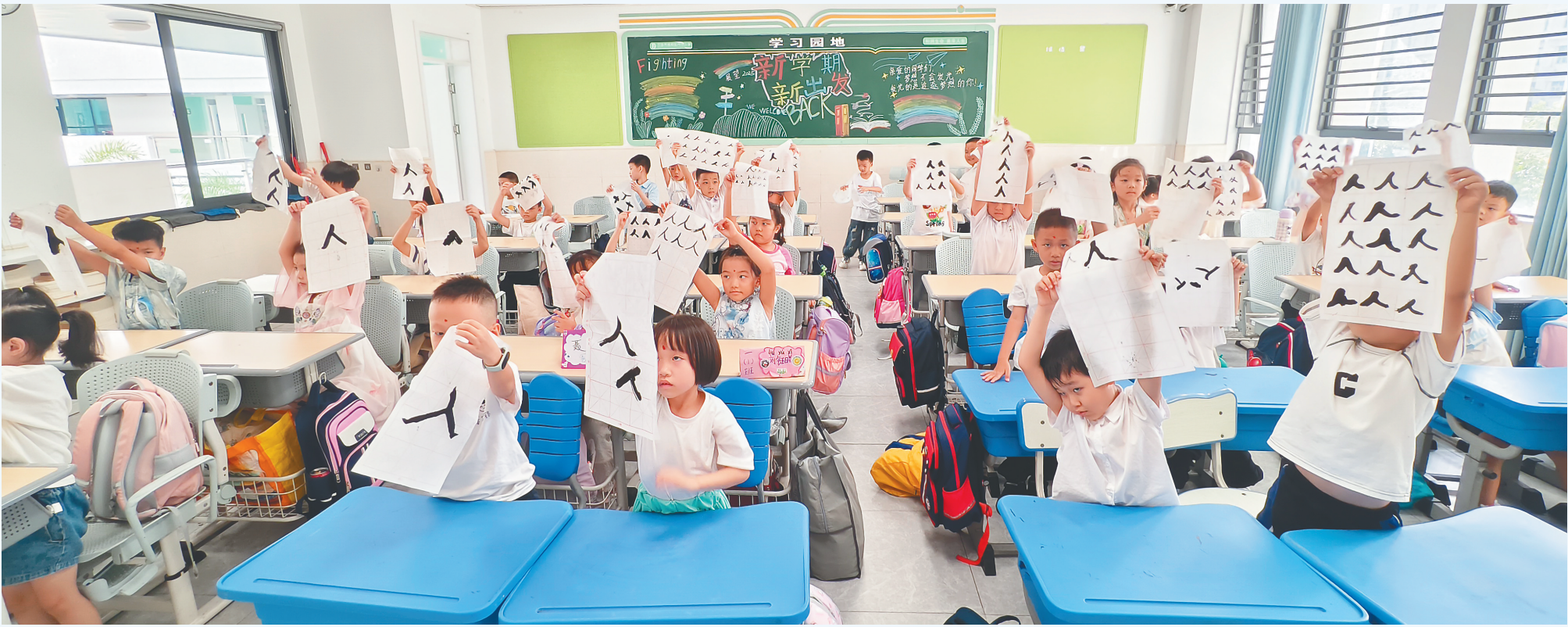
9月1日,三亚市丹州小学内,孩子们在老师的指导下学习写“人”字。