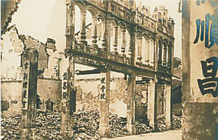
1939年4月，在日军入侵中，琼东县（今琼海市）嘉积镇新民街被日军炮火炸成废墟。