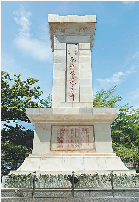
昌江石碌铁矿国家矿山公园里的死难矿工纪念碑。（资料图）