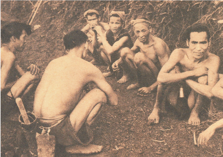
被日军强征的海南劳工，被迫在极端恶劣的环境中劳动。