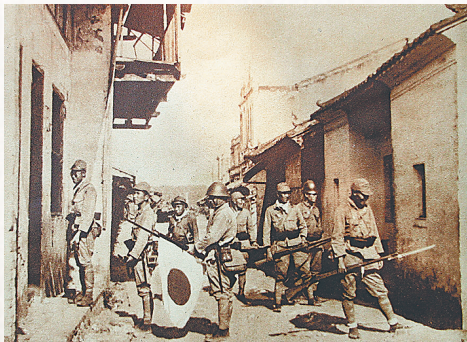
1939年，日军在文昌县清澜港进行“扫荡”作战。