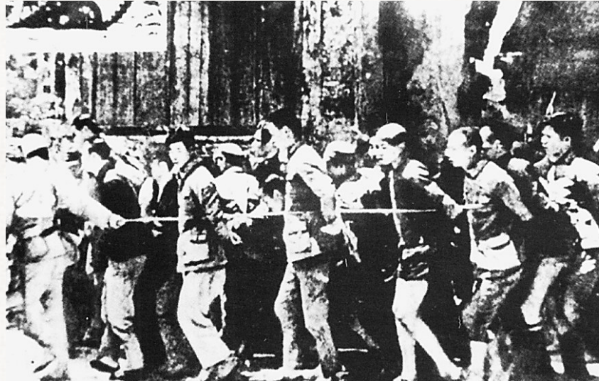
1941年4月19日，日军将海口市民逮捕后运往郊外屠杀。