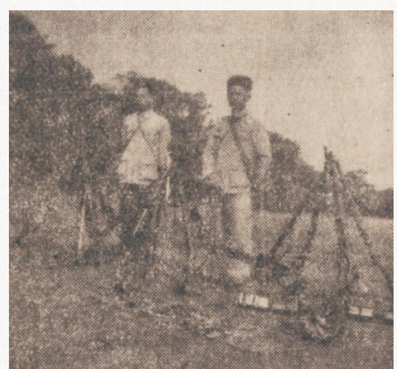
1939年底,独立总队缴获的部分日军武器。