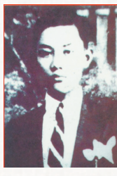
陈琴 (1911—1940) 琼崖华侨 回乡服务团副团长