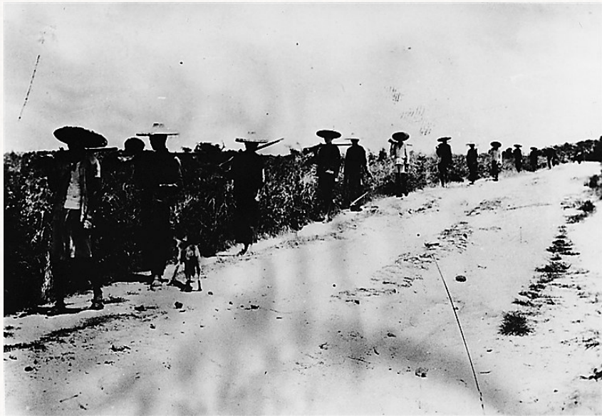
转战在敌后的部分琼崖抗日独立总队战士。