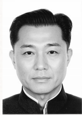
林伯熙 (1909—1942) 琼崖抗日独立总队 第三支队支队长