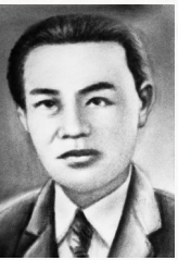
黄振亚 (1905—1940) 琼崖抗日独立总队 第三大队大队长