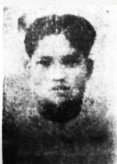
黄金容 (1902—1940) 中共儋县县委书记、琼崖抗日 独立总队第六大队政训员