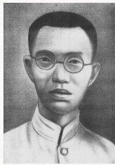
黄魂 (1903—1944) 琼崖抗日独立总队 政治部主任