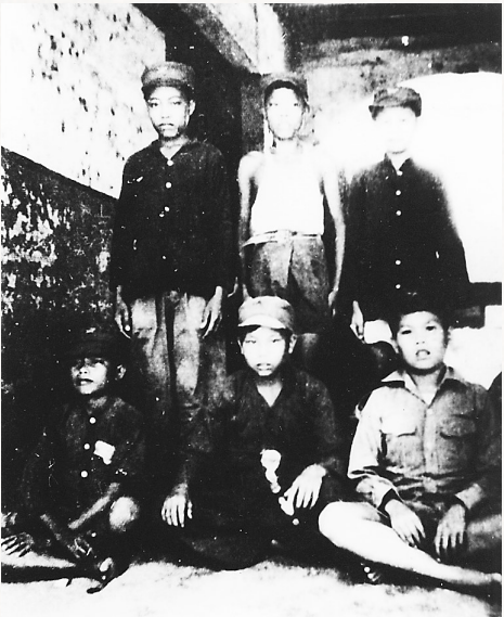
琼崖抗日独立总队“少年连”战士。