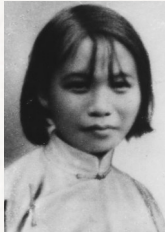
许如梅 (1919—1943) 琼崖抗日独立总队 第一医务所指导员