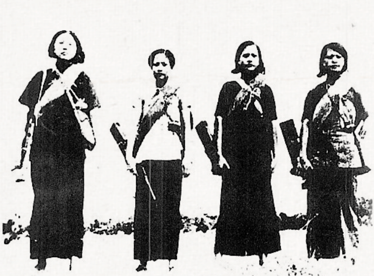
在机关担负保卫电台任务的娘子军排战士。她们在后来的战斗中先后牺牲。

在“红旗不倒”的旗帜下，琼崖各族群众与抗日部队结下鱼水深情，用智慧与生命为抗战胜利