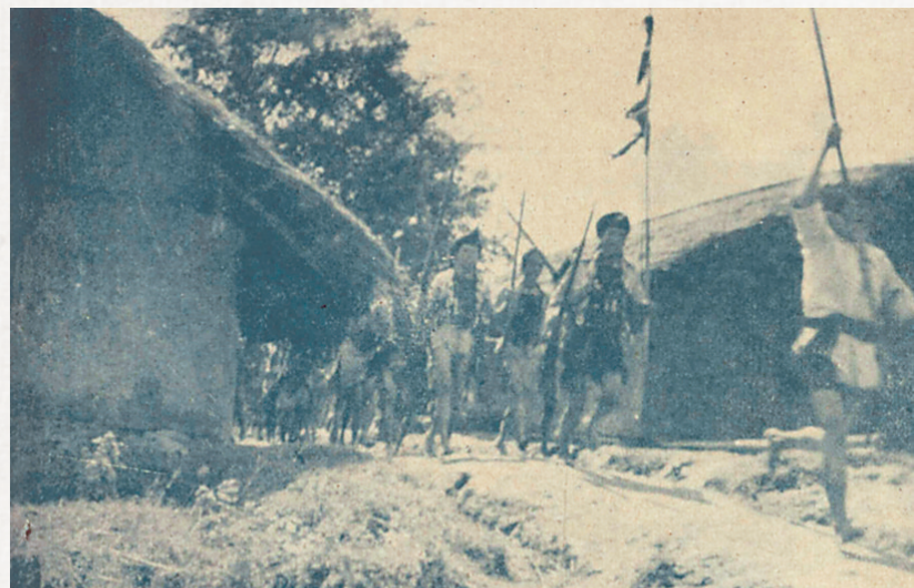
1938年，随着华南局势紧张，陵水、保亭一带的黎族群众同仇敌忾，自发组织开展军事训练。

据史料记载，全民族抗战时期海南共有烈士8077人（仅为有记载可查的）。今天，战争的硝烟早已散尽，风声犹在耳畔。九泉之下，为抵抗日寇血洒琼崖的烈士，该如何描摹你们的画像？该怎样书写你们抛头颅、洒热血的初心？让我们循着历史脉络，在鲜活的片段里，触摸他们曾经跳动的脉搏。