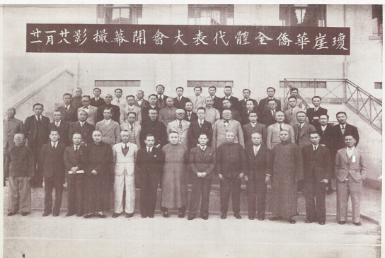
1939年1月,琼崖华侨全体代表大会在香港召开,会议决定组织琼崖华侨联合总会回乡服务团,返乡参加抗战。