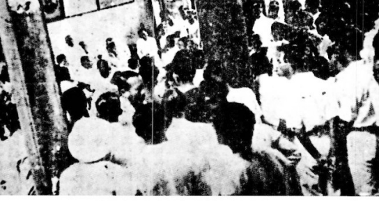
旅居南洋的琼侨集会捐款支持家乡抗战。本版图片取自省委党史研究室编撰的《海南抗战图集》