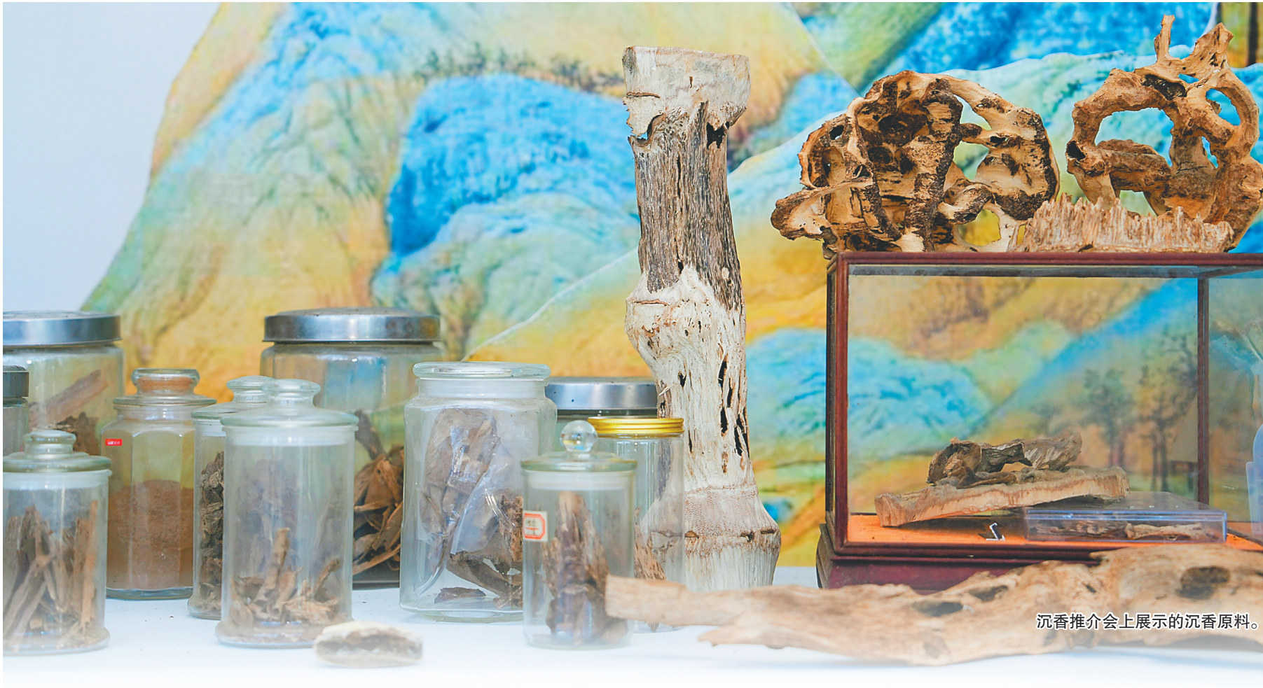
沉香推介会上展示的沉香原料。

澄迈被誉为“中国沉香之乡”，是我省沉香主要分布区和主产地之一，3万亩沉香林年产值破亿元。通过构建“一乡引领、两核驱动、四镇协同、六地联动”的“1246”发展格局，走出一条产业振兴之路。