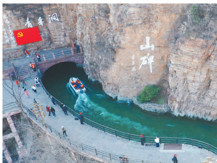
游客在红旗渠风景区青年洞附近游玩。