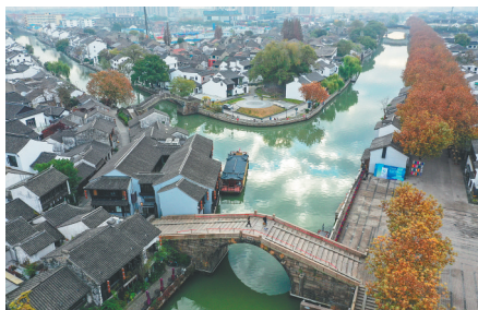
江苏无锡古运河畔的清名桥历史文化街区。