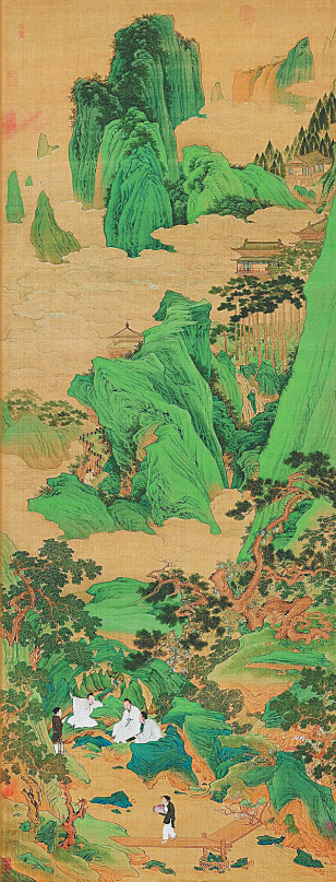
仇英《桃源仙境图》（天津博物馆藏）。