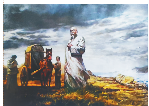
油画《林则徐贬谪伊犁》，现藏鸦片战争博物馆。