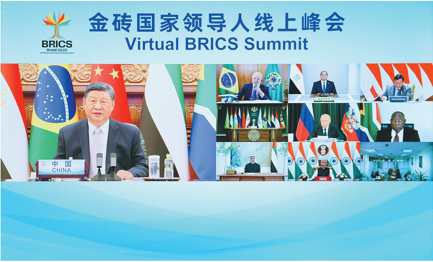
9月8日晚，国家主席习近平出席金砖国家领导人线上峰会，并发表题为《团结合作 砥砺前行》的重要讲话。

新华社北京9月8日电(记者杨依军 邵艺博)9月8日晚，国家主席习近平出席金砖国家领导人线上峰会，并发表题为《团结合作 砥砺前行》的重要讲话。 巴西总统卢拉主持峰会，俄罗斯总统普京、南非总统拉马福萨、埃及总统塞西、伊朗总统佩泽希齐扬、印度尼西亚总统普拉博沃、阿联酋阿布扎比王储哈利德以及印度、埃塞俄比亚代