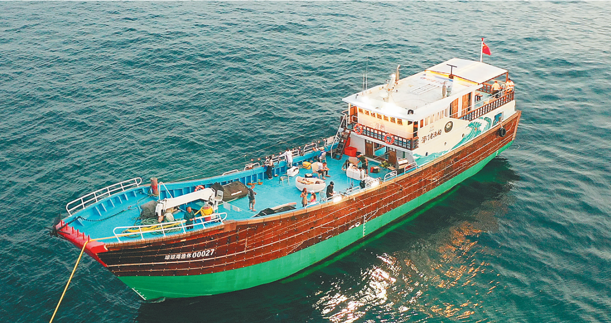
在琼海潭门镇附近海域，游客在休闲渔船上垂钓。