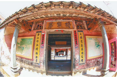
冯氏大宗祠第一进将军第。