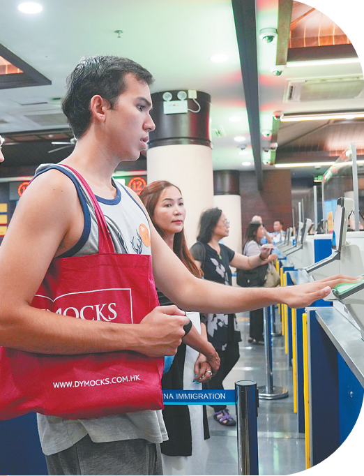
丽星邮轮“领航星”号上的外籍游客在三亚办理通关手续。