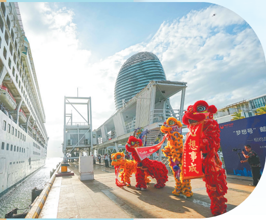
去年1月,“梦想号”邮轮驶抵三亚。 (资料图)