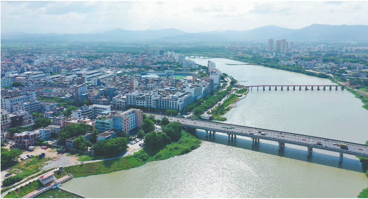
俯瞰宁远河畔的拱北村。