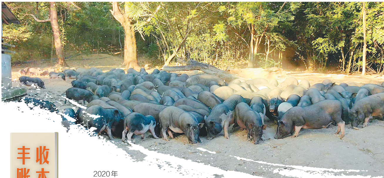
韦秀芳养殖的琼中五脚猪。通讯员 王丽娟 摄

今年6月,韦秀芳带着以琼中五脚猪为原材料制作的肉脯前往新加坡进行推介,获外商青睐。她正在有关部门的协助下办理出口需要的审批资质,为琼中五脚猪“出海”做准备。