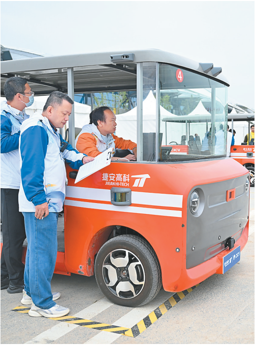
9月21日,选手在智能网联汽车装调运维项目比赛中。