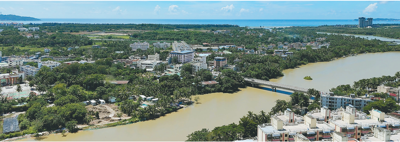
航拍三亚藤桥河畔的南田社区。