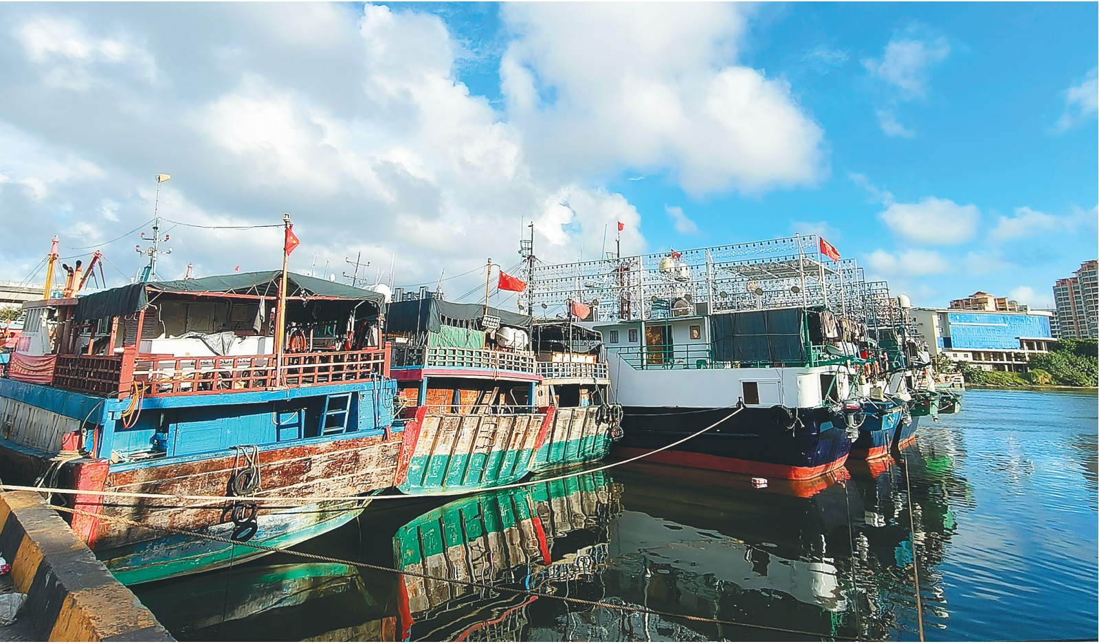
琼海：1504艘渔船回港避风

文昌市防灾减灾救灾和安全生产委员会发布《关于实施“五停一关”的预告》称，为最大程度保障人民群众生命财产安全，文昌市拟定于10月4日中午至10月5日，在全市范围内统一启动“五停一关”（即停课、停工、停业、停运、停航、关闭景区）措施，按分时段方式逐步推进实施，具体启动时段、操作要求，将以后续发布的正式通告为准。