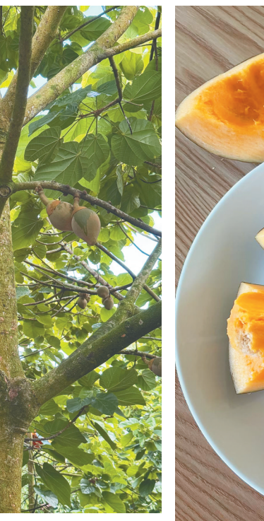
切开后，椰蜜果。