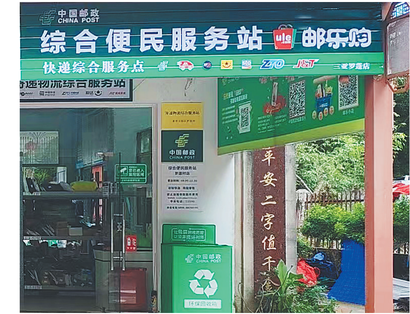
海南优化推广村级寄递物流综合服务站，服务乡村全面振兴。

之间的行李往返寄递，服务游客“在琼轻松游”；率先在全国实现司法专递电子单改革试点全覆盖，“不见面审批”政务寄递服务有效助力政务服务“零跑动”……2023年至2024年海南邮政普遍服务消费者满意度均列全国第2。 服务城乡，久久为功。今年前8个月海南省快递业务量超2亿件，在2023年、2024年连续2年突破2亿件基础上，今年较2024年提前约2个月再次突破2亿件，邮政快递业已成为连接生产和消费活跃畅达的“毛细血管”。