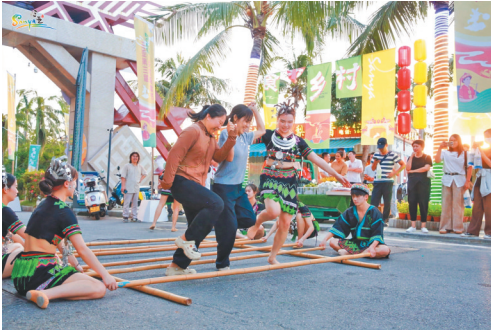
三亚乡村美食节上举办的竹竿舞活动。

“双节”期间，三亚CBD各商圈积极探索商业与文化的深度融合，通过开展特色营销活动，将社交文化、情绪价值融入消费场景，引发消费热情。其中，“2025年‘鹿’生花国庆潮购节”，创新采用“1+8+N”联动模式，串联八大重点商圈，融合多元互动形式，构建起差异化、主题化的全域消费新格局。夏日站等主打“亲子娱乐+文旅融合”，举办周年庆典、黎族舞蹈、糖果巡游、凤凰飞天等表演。海旅免税城与中服免税等免税业态聚焦“高端潮购+科技互动”，推出机器人舞蹈、AI糖画体验及黄金挂件抽奖等活动。三亚湾壹号等社区商业体则侧重“便民惠购+潮流体验”，通过热气球体验、非遗舞台秀、古风市集及乐队现场表演等形式，满足不同客群的消费偏好。