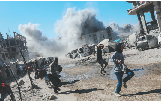
加沙城一座高层建筑遭以色列军队空袭，民众纷纷躲避。