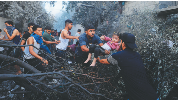
人们从加沙地带中部地区一处被炸难民营逃离。