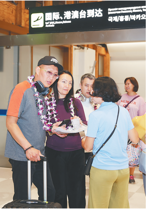
近期，三亚开通往返明斯克、乌兰巴托、吉隆坡等多条国际航线，吸引众多境外游客体验魅力海岛游。

为合作机遇而来，来自格鲁吉亚的大飞机在海南自贸港“振翅”高飞，越飞越远。一手牵着海口美兰国际机场，一手牵着三亚凤凰国际机场，格鲁吉亚航空集团董事长塔马兹·盖亚什维利倍感振奋：格鲁吉亚航空成为海南最重要的两座民航机场合作伙伴，并携手共同开通了全货机航线，开辟国际贸易新航线。 “第比利斯—海口—米兰”“第比利斯—三亚—米兰”，这两条国际货运航线，极大促进了海南与欧洲之间的跨境电商、免税商品及高端消费品的双向高效流动，推动海南自贸港“空中丝绸之路”物流大通道能级跃升。