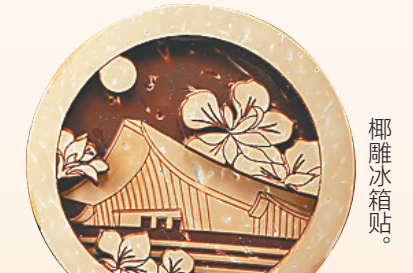
本版图片均为资料图