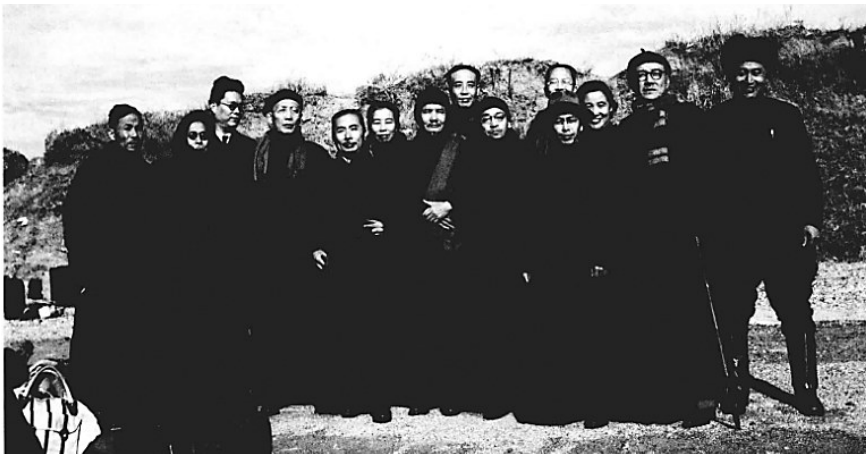
“华中华”轮船抵达东北解放区，民主人士登陆后合影。左起：翦伯赞、马叙伦、宦乡、郭沫若、陈其尤、许广平、冯裕芳、侯外庐、许宝驹、连贯、沈志远、曹孟君、丘哲、中共丹东地区领导人。